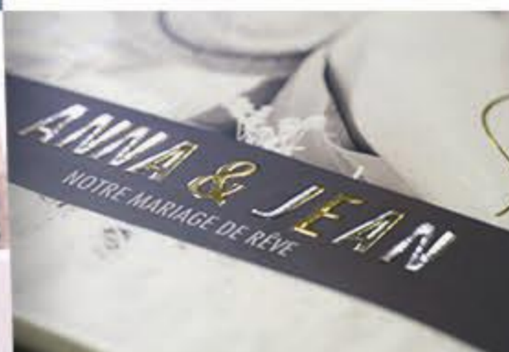
Encre métallique dorée