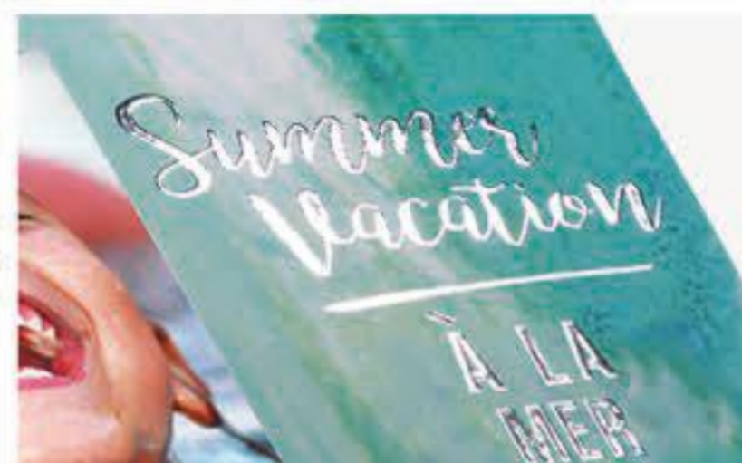
Encre métallique argentée